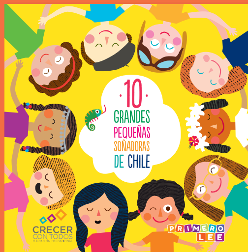
10 Grandes pequeñas soñadoras de Chile.