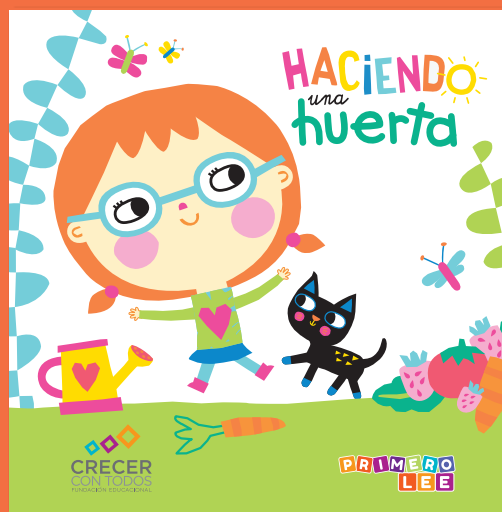
Haciendo una huerta.